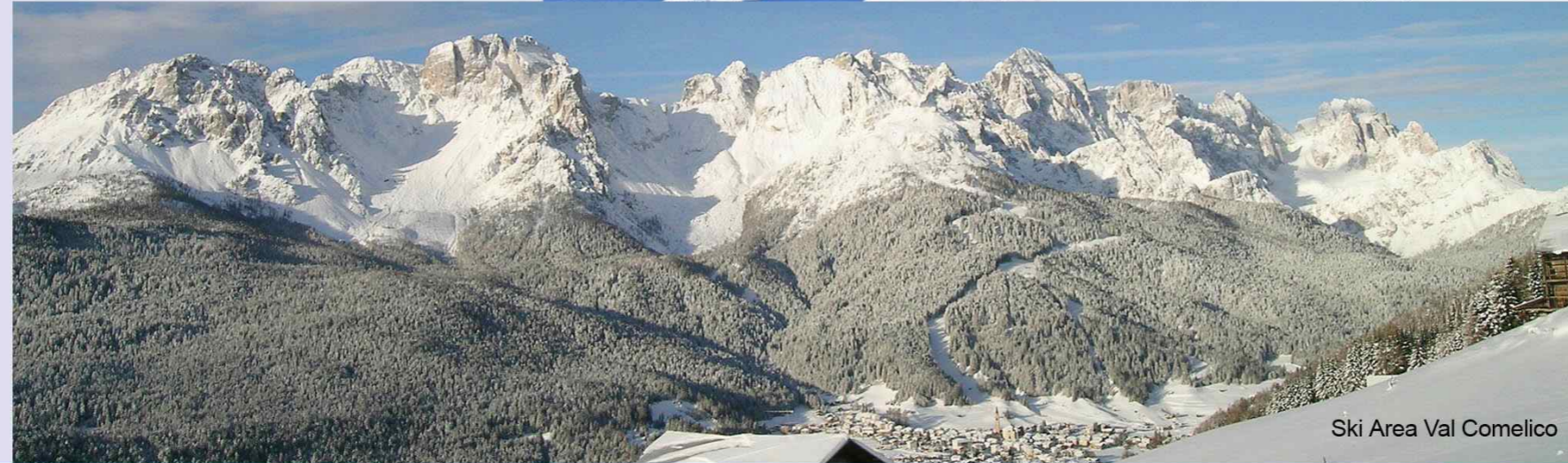
Ski Area Val Comelico